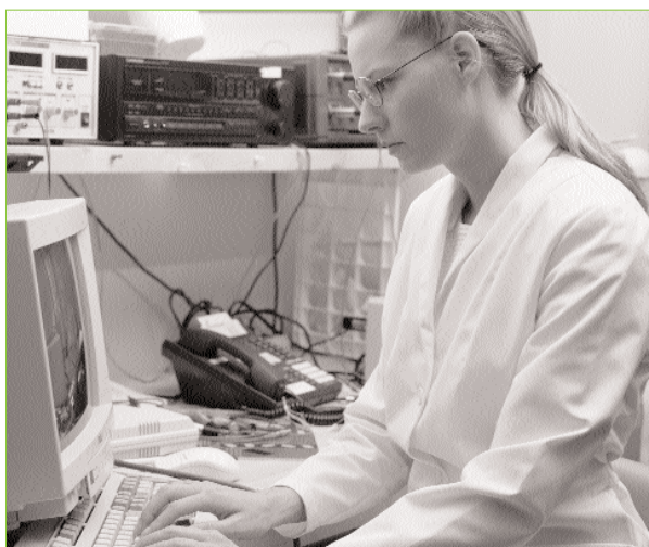
■ Abbildung 1: Die elektronische Vernetzung der Hausarztpraxen mit der Ambulanz des hausärztlichen Bereitschaftsdienstes, mit dem labordiagnostischen Zentrum und der Universität Maastricht ist ein zentrales Element des niederländischen Praxismodells.

Alle Praxen im Raum Maastricht sind mit der Ambulanz des hausärztlichen Bereitschaftsdienstes via PC vernetzt. Die Zugänge werden über Codes geregelt, wobei Informationen nur durch die niedergelassenen Ärzte abgerufen werden können. Die Ambulanz kann keine Daten der Niedergelassenen einsehen. Anamnese, Diagnosen, Befunde, Medikation und Prozeduren werden durch den Notdienst in den PC eingegeben und per E-Mail an den Hausarzt gesendet, bei dem sich der Patient normalerweise in Behandlung befindet. Somit kann der Hausarzt bei der nächsten Konsultation des Patienten sofort alle wichtigen Informationen einsehen. Auf diesem Weg lassen sich Informationsdefizite oder Verzögerungen von Mitteilungen vermindern.